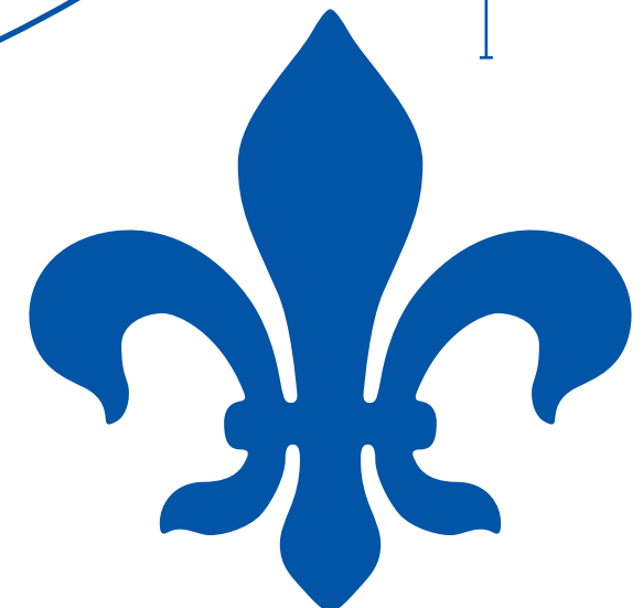
Lilie zum Aufnähen oder nachträglichen Aufmalen